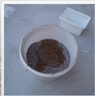
Dodaj żywicę do pojemnika z kamieniami