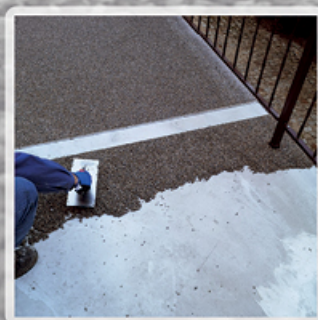
Rozprowadź kamienie na wcześniej przygotowane podłożu