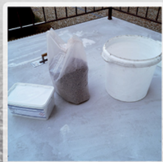
Kamienie przesyp do czystego, suchego pojemnika