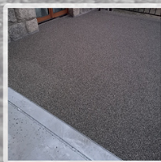
Pozostaw do całkowitego wyschnięcia