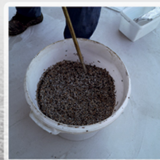
Wymieszaj dokładnie spoiwo z kamieniami