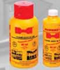
N Dodatek do przygotowania tynku renowacyjnego