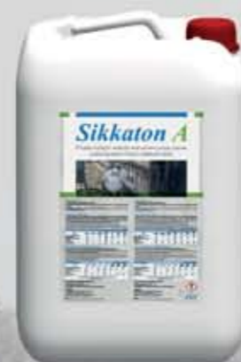
Sikkaton A Wodoszczelny dodatek do mieszanek betonowych (0,4 mm)