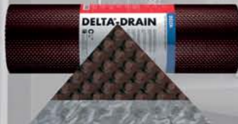
MS Drain Mata drenażowa