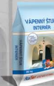
Interier stiuk Stiuk wapienny