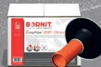
EasyPipe Rozwiązanie problemu szczelności (8mm-160mm)