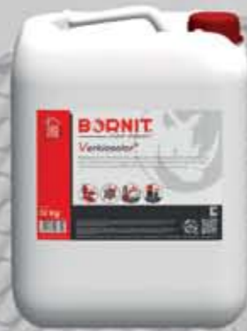
Verkieseler Preparat gruntujący głębokopenetrujący