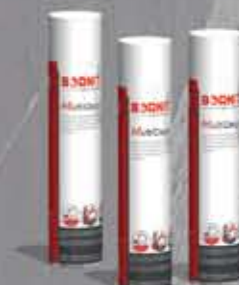
MultiClean Środek czyszczący bitum (owocowy)