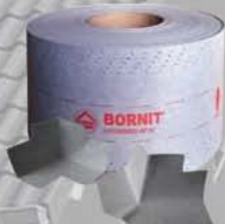
FB+ Taśma uszczelniająca