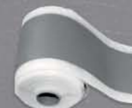
FBF Fundamentowa taśma uszczelniająca