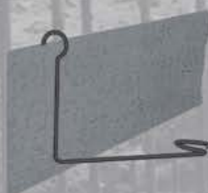
Fugenblech Aktywna blacha do uszczelnienia przerw roboczych