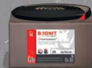
Dreiecksband Trójkątna taśma bitumiczna (kąty wewnętrzne)