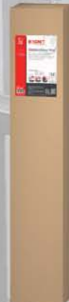
BORNIThene PLUS Samoprzylepna izolacja bitumiczna (-5°C)