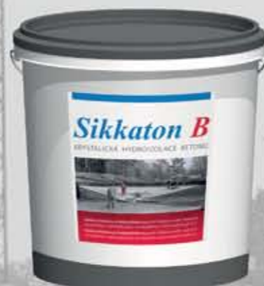
Sikkaton B Zaprawa do wtórnej ochrony betonu (0,4 mm)