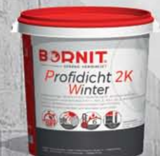
Profidicht 2K Winter Zimowa, szybkoschnąca, bitumiczna masa uszczelniająca (-5°C)