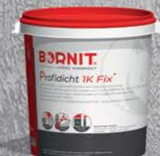
Profidicht 1K Express Jednoskładnikowa, grubowarstwowa masa bitumiczna