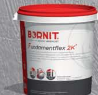
Fundamentflex 2K Dwuskładnikowa, grubowarstwowa masa bitumiczna