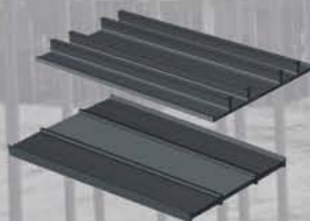
Taśmy do przerw roboczych