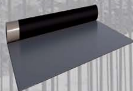
FBV Kompletny system uszczelniający do świeżego betonu