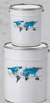
Epoxidkleber 2K Klej epoksydowy (2K)