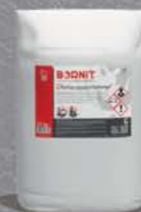
Dichtungsschlämme Mineralna zaprawa uszczelniająca