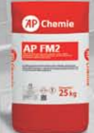
FM2 Zaprawa do murowania oraz spoinowania ścian (z traniem reńskim)