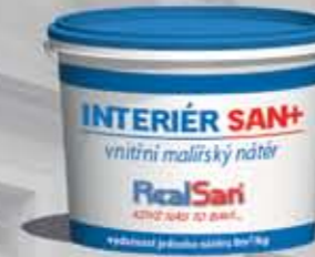
Inter San + Odporna na ścieranie, biała farba do ścian i sufitów