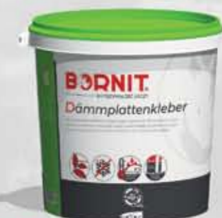
Dammplattenkleber Bitumiczny klej do płyt izolacyjnych