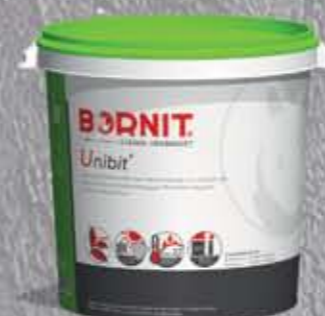
Unibit Cienkowarstwowa powłoka bitumiczna odporna na UV (koncentrat)