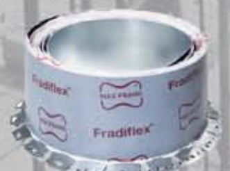
Fradiflex Blacha do przerw roboczych pokryta elastomerową powłoką adhezyjną