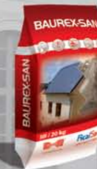
San Tynk renowacyjny termoizolacyjny i suszący