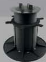
Renopad Wsporniki regulowany na taras