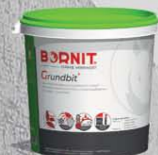
Grundbit Elastomerowo-bitumiczny szybkoschnący preparat gruntujący