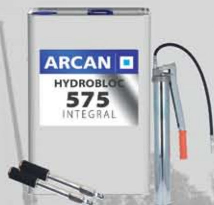
Hydrobloc 575 Żywice iniekcyjne do tamowania przecieków (IK)