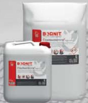
Elastikschlämme UV Elastyczna masa uszczelniająca (MDS)