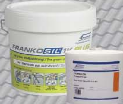
Frankosil 1K Plus UV Bezrozpuszczalniokowa hybryda poliuretanowa (FLK)