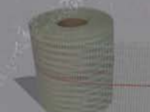
Roll-Eckgewebe Rolowana siatka wzmacniająca narożna 24 cm (kąty zewnętrzne)