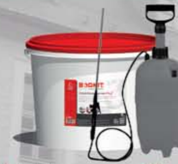
Injektionscreme Plus Krem do iniekcji na bazie silanu